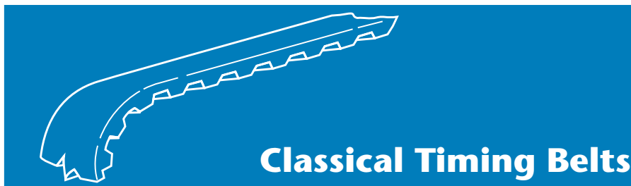
Classical Timing Belts